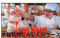
水輪名物にんじんジュース