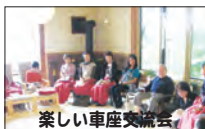
楽しい車座交流会