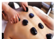
セラピーでのんびり