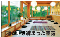
涙と目を癒した空気