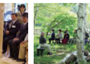
帯津先生と気功三昧