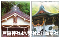
戸隠神社と秋の御願電柱