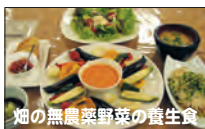
畑の無農薬野菜の養生食