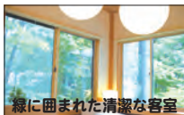
緑に囲まれた清潔な客室