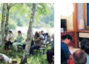
帯津先生に何でも質問OK