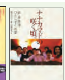
塩澤みどり監修 原書房