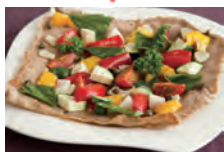
お野菜たっぷりそばガレット